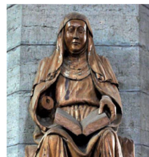
Heliga Birgitta avbildad i ett träsnitt som idag finns på Vadstena kloster. Troligen från 1392.