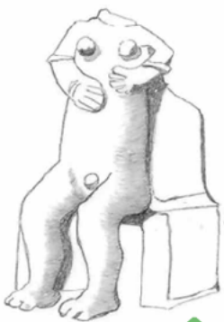
Figurin från Ungern 4800-4700 BCE, som Gimbutas tolkar som en gud med både bröst och penis. (Gimbutas The Living Goddess 1999 p. 17, Fig 9)