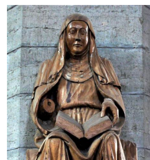
Heliga Birgitta avbildad i ett träsnitt som idag finns på Vadstena kloster. Troligen från 1392.