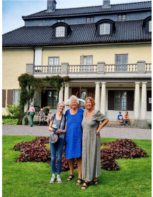
Bild på oss tre utanför Mårbacka