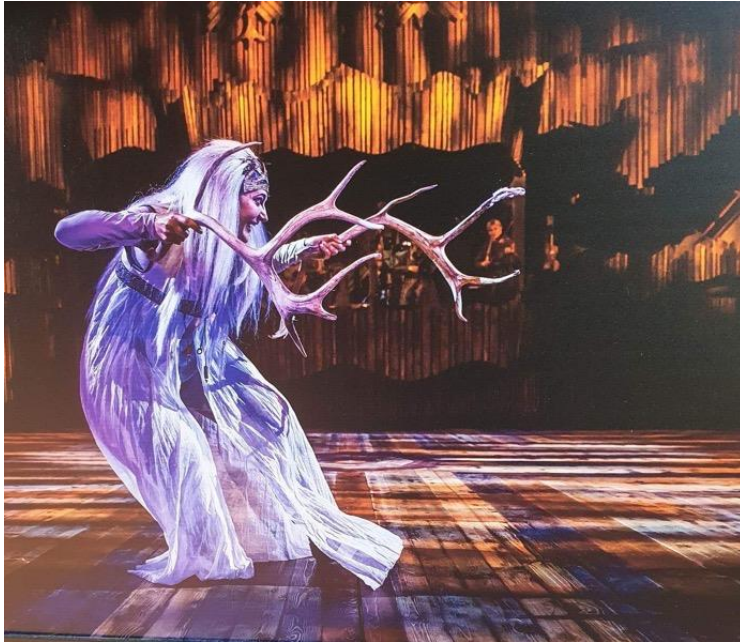
från affisch- Månens dotter.

Máttaráhkka, den stora modergudinnan, berättar hur världen blev till och människorna skapades. Till sin hjälp har hon sina tre döttrar: Saráhkka, Juoksáhkka och Uksáhkka.