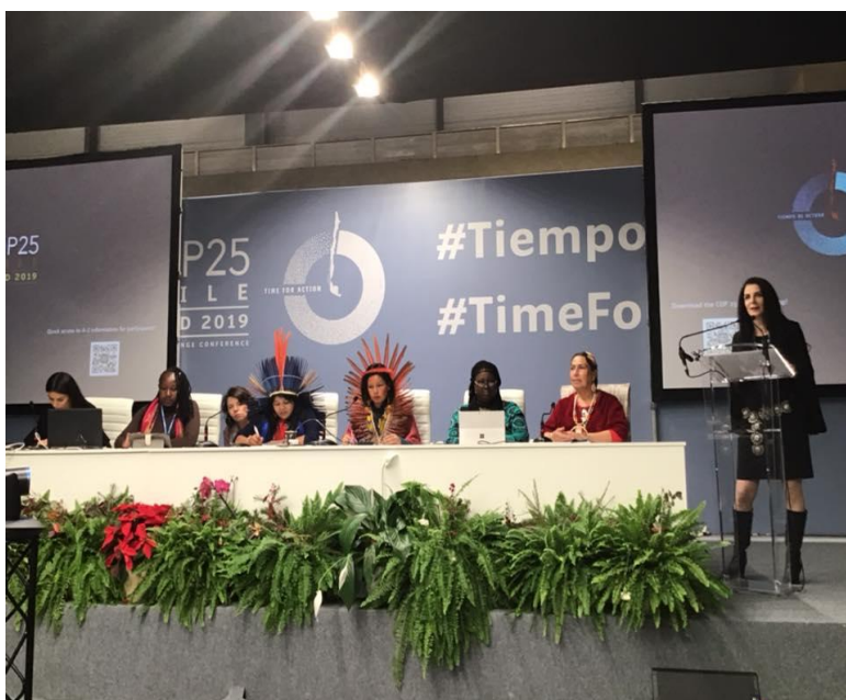
Ledare inom olika Urfolk

Vi är helt eniga om att Naturens rätt och Kvinnors rätt ska gå hand i hand och genomsyra hela Parisavtalet. Inga försvagningar i texten om Mänskliga Rättigheter accepteras och Gender Equality ska mainstreamas, dvs inkluderas i alla artiklar. Det gäller alla länder! Gröna Kvinnor påminde parlamentariker om just detta på ett frukostmöte vi blev inbjudna till av de Europeiska Gröna delegaterna. Inom EU leder Sverige jämställdhetsarbetet.