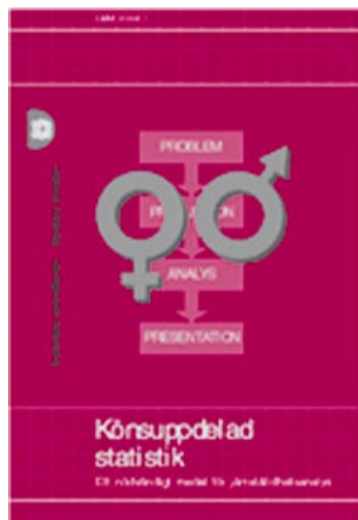
SCB:s lilla rosa.

För att komma vidare i jämställdhetsarbetet har FN uppmanat alla länder, som undertecknat Pekingdokumentet, att könsuppdelad statistik.